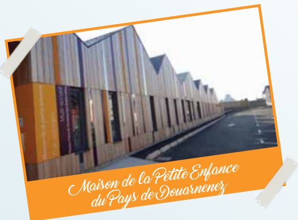
Maison de la Petite Enfance du Pays de Douarnenez