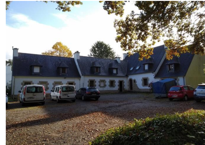
Site de Kergreis